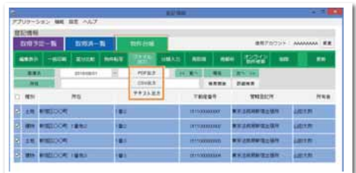
物件台帳から様々な形式で出力 (PDF、CSV、テキスト)

物件台帳からは表題部所有者、甲区、乙区、管轄登記所等の情報をテキスト形式、CSV形式で外部に出力できます。利用目的に応じてExcelに取り込んで加工をしていただくことも可能です。