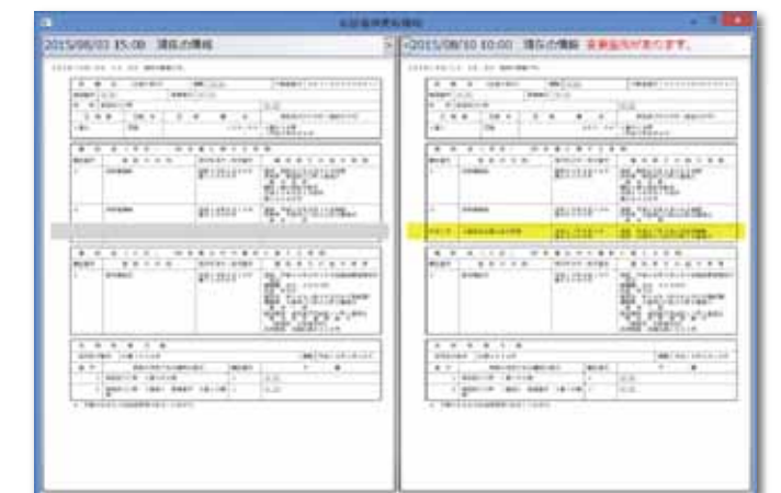
前回取得データとの差分比較