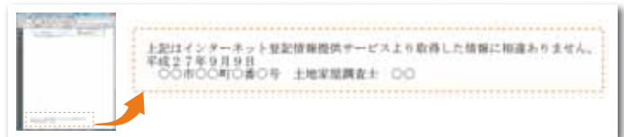
奥書付き印刷も可能

物件台帳から登記情報のPDF形式での印刷はもちろんのこと、末尾に奥書を付けた印刷もできますので、依頼者へ提出する場合も便利です。複数の登記情報に対してまとめて一括印刷を行うことも可能です。