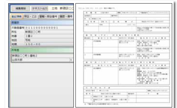
登記情報確認画面