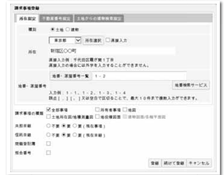
請求事項登録画面

同一物件を複数回取得した場合は、都度の履歴管理に加えて、前回取得した情報との比較機能により、差分をわかりやすく色表示します。過去に取得した登記情報と取引直前の状態に差異がないかどうか素早く把握することができます。